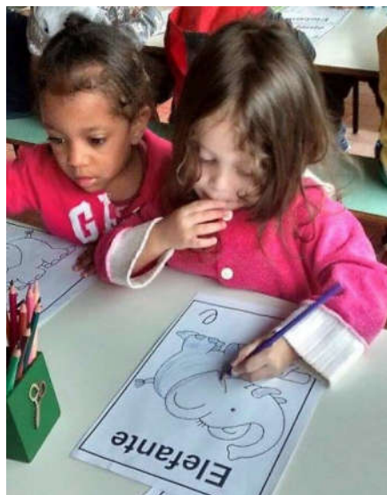
Scholing is het krachtigste wapen om de wereld te veranderen (Nelson Mandela)

Onze kleuters bedanken u hartelijk voor uw gift!