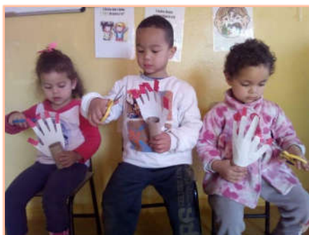
Kinderen krijgen les over nagels knippen

In de arme wijk Itapecerica da Serra in São Paulo blijft ons project APIS een belangrijke rol spelen voor ouders, kinderen en leerkrachten. Kleuters hebben veel te leren en APIS pakt dit aan door belangrijke thema's te verwerken in allerlei leuke activiteiten. Tandenvoetsen, gezond eten en zindelijkheid worden dan een spel, een tekening, een toneelstuk, een dansje, een sportoefening! De thema's vergroten de zelfredzaamheid van de kinderen maar