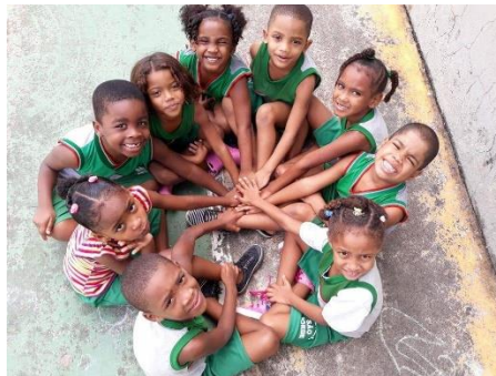
Samen hebben we de wereld in onze hand!

van de afgelopen jaren. Tegelijk levert het verkiezingsresultaat nieuwe onduidelijkheid op over het nieuwe beleid. Daardoor is het vertrouwen van consumenten en investeerders gedaald, wat niet helpt voor economisch herstel. De vooruitzichten voor 2019 blijven daardoor onzeker.