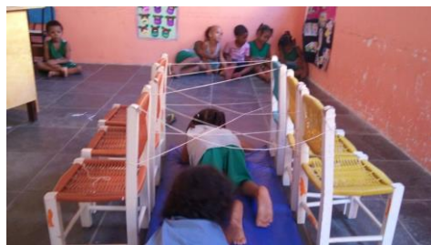
Aandacht voor motoriek in de schooltjes

Ondanks alle uitdagingen in Brazilië maken de leerkrachten van APIS er elke dag weer een leuke en leerzame dag van. Ze proberen op een ludieke manier aandacht te besteden aan het samen leren en spelen en betrekken de ouders daar regelmatig bij. Zo is ook dit jaar weer met de kinderen, ouders, leerkrachten en buurtbewoners uitgebreid het Festa Junina -feest gevierd. Er werd gedanst, muziek gemaakt, spelletjes gedaan, leuk verkleed en heerlijke gerechten gemaakt. Iedereen droeg zijn steentje bij en voelde zich veilig en geborgen bij APIS. De ondersteuning die de mensen en kinderen niet krijgen van de Braziliaanse gemeente en overheid, krijgen ze gelukkig wel van alle trouwe leden van de stichting. Hiervoor veel dank!