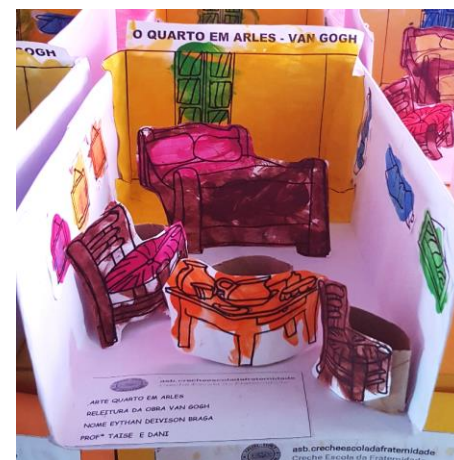
Knutselen met Van Gogh!

leerkracht uitgegroeid naar coördinatrice van het schooltje.